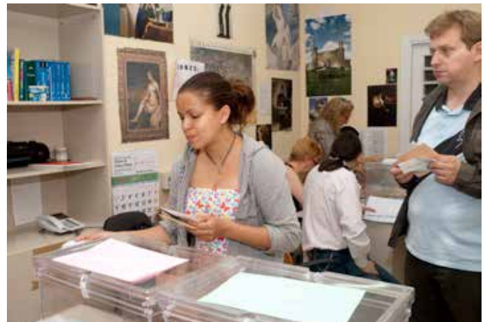
En estas elecciones podrán votar 463.765 extranjeros que residen en nuestro país.

bleas de las Ciudades Autónomas de Ceuta y Melilla. Los países con más españoles inscritos en el censo para esta convocatoria son Argentina (147.442), Francia (105.109), Venezuela (99.281) y Cuba (72.149).