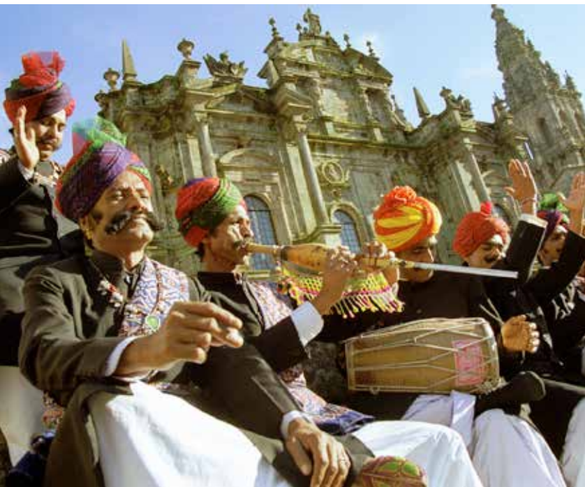
Fomentar la diversidad cultural y la convivencia ciudadana es uno de los objetivos de la Estrategia y, por tanto, del convenio suscrito.

El desarrollo de las acciones previstas en el convenio tendrán en cuenta la diversidad cultural y lingüística del Estado español y tratarán, al mismo tiempo, de mejorar el equilibrio territorial en el acceso a la cultura, tales como los destinados a la conmemoración de efemérides de relevancia cultural, los que tengan por objeto ampliar la difusión de los promovidos con este fin a otros territorios o la creación de rutas culturales, entre otros. ★