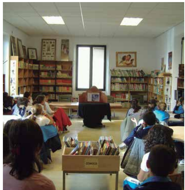
La FEMP quiere que se reconozca el inestimable papel de las bibliotecas municipales en el fomento de la lectura.

Desde la Federación se alude, además, a la participación de estos centros en las Campañas de Animación a la Lectura María Moliner que, en su última edición, concitó 609 proyectos elaborados y rea-