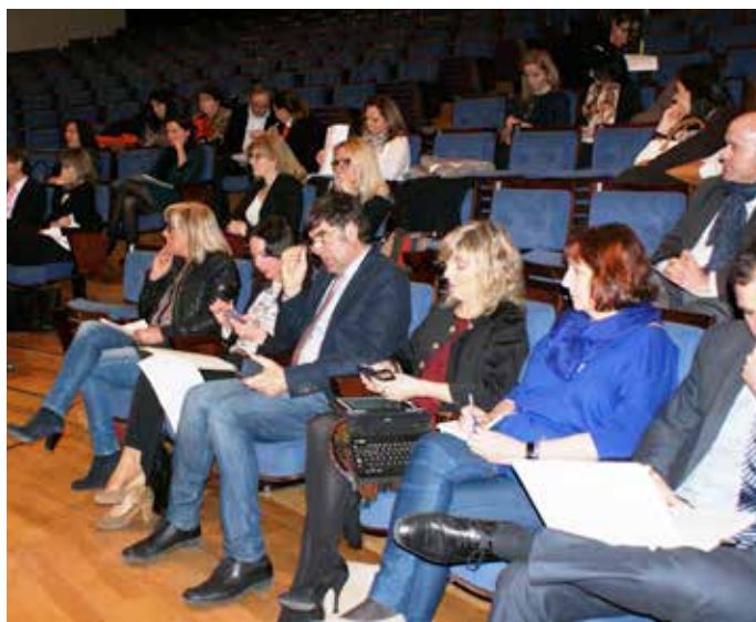
Al encuentro acudieron cerca de un centenar de profesionales del sector del turismo de reuniones (MICE).

También argumentó que el turismo de negocios da mucha riqueza al país y que "España debe mucho a las ciudades que invierten en