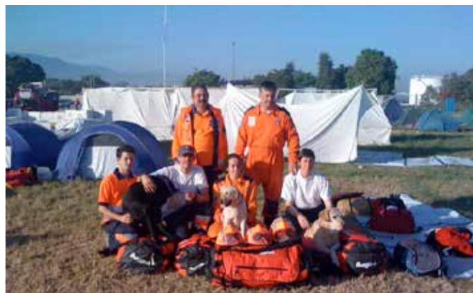
La nueva Ley incorpora aspectos no regulados hasta ahora, como el voluntariado internacional.

En cuanto a los derechos y deberes de los voluntarios, y esto es una novedad, se garantiza la igualdad en el acceso al voluntariado de las personas en situación de dependencia en los formatos adecuados y en las condiciones acordes a sus circunstancias personales, algo que en el Anteproyecto de Ley figuraba para las personas con discapacidad y las personas mayores. Además, se fija en doce años la edad mínima para que participen menores en proyectos.