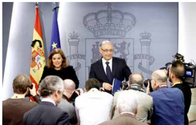
El Ministro Montoro dio los últimos datos de déficit público en el Consejo de Ministros del 27 de marzo.

Con los resultados obtenidos, el sector local español mantiene la tendencia de reducción que ya inició en ejercicios anteriores. También mantienen su tendencia, aunque en sentido contrario, las Administraciones Autonómica y Central del Estado. La primera ha subido 4 décimas en el PIB (con unos valores de 236.747 millones de euros) y la segunda se mantiene en el mismo porcentaje sobre PIB, aunque ha crecido en casi 4.000 millones de euros para situarse en 895.852 millones. ★