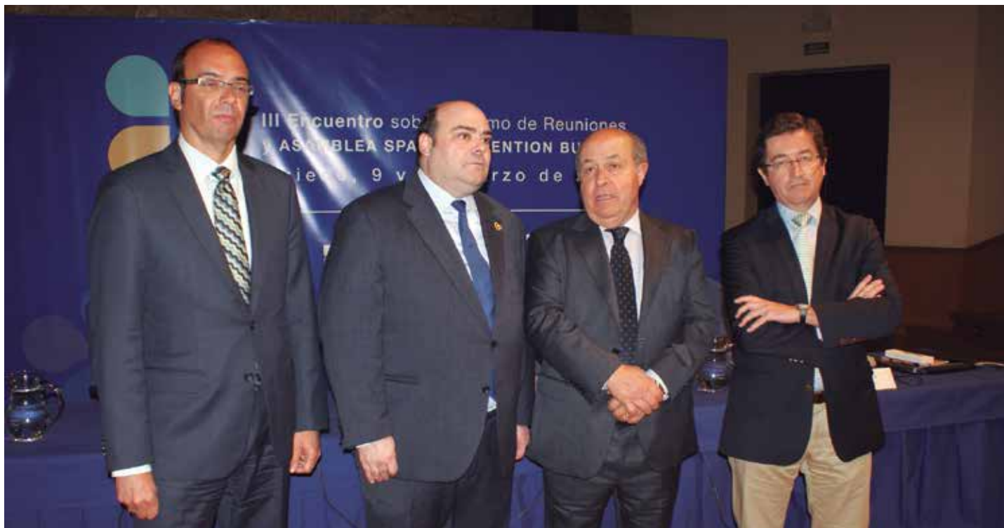
Los Alcaldes de Oviedo y Granada, en el centro, con el Subdirector Adjunto de Desarrollo y Sostenibilidad de la Secretaría de Estado de Turismo y el Secretario General de la FEMP, en la inauguración del encuentro.

En este ámbito de actuación, el Alcalde de Granada recordó, al respecto, la firma el pasado año en esa ciudad de un Convenio con la Marca España, “que nos permite colaborar con ellos en difundir los importantes activos que proyecta nuestro país en los mercados internacionales” .