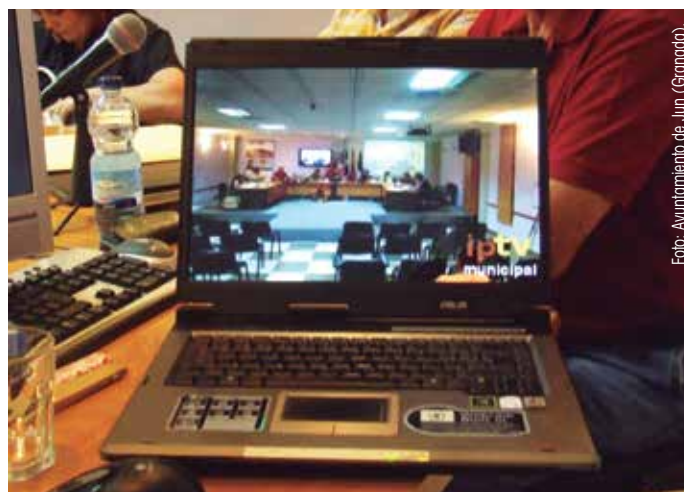
El Código contempla la irrupción de las Tecnologías de la Comunicación en el comportamiento de la Administración.

Por último, el Código abre la posibilidad de que se adhieran a sus objetivos la totalidad de los empleados públicos locales, así como aquellos sujetos proveedores de servicios a la Administración Local y perceptores de fondos públicos.