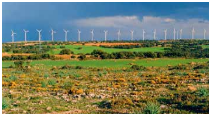
Los proyectos que se presenten tendrán que estar centrados en aspectos ambientales y energéticos.

Otro de los principales objetivos específicos será aumentar el uso de las energías renovables para producción de electricidad y usos térmicos en edificación y en infraestructuras públicas, en particular favoreciendo la generación a pequeña escala en puntos cercanos al consumo.