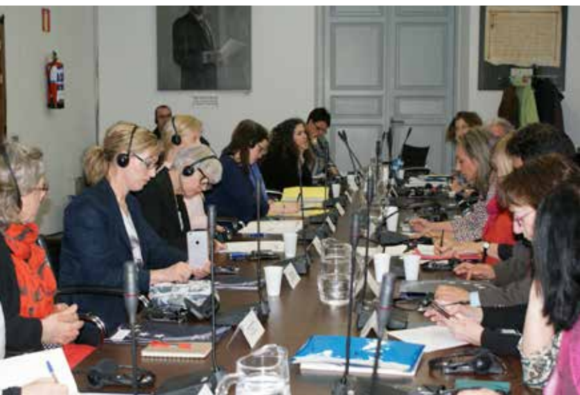
La FEMP fue el escenario de varias reuniones de seguimiento del proyecto.

No obstante, Liss Shanke considera que lo importante para la gente que trabaja dentro de los municipios, lo esencial, es cómo se pueden dar los mejores servicios para los habitantes. "Y este reto es común para todos los municipios, aunque las soluciones puedan o no ser diferentes" .