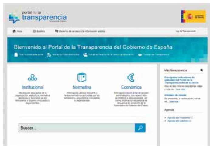
El MINHAP habilitará una plataforma técnica, análoga al Portal de Transparencia de la Administración del Estado.

El Ministerio también pondrá a disposición de las Entidades Locales interesadas un curso-guía en soporte electrónico sobre el uso de las utilidades y herramientas propias del Portal de Transparencia Local.