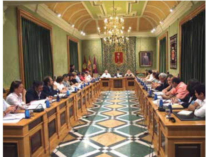
Pleno del Ayuntamiento de Cuenca.

"El desempeño de responsabilidades públicas exigirá el respeto a la normativa en materia de conflicto de intereses" . Con esta frase, el Código desgrana los compromisos éticos sobre conflictos de intereses en los que tienen que basarse los cargos electos locales y directivos de esta Administración.