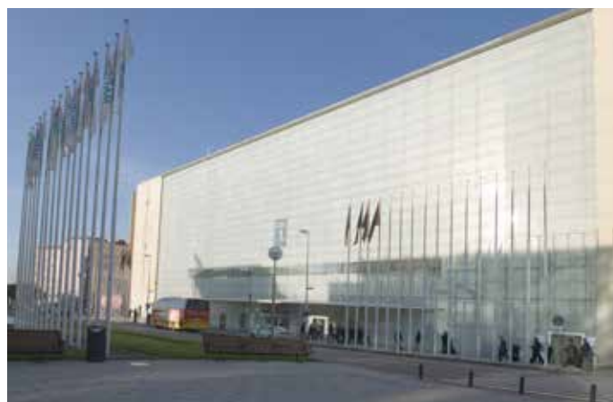
Palacio Municipal de Congresos de Madrid.

En cuanto al desarrollo del mismo, el Reglamento recoge el procedimiento de constitución de la Mesa así como las atribuciones y responsabilidades de ésta. El Pleno desarrollará sus funciones a través de las reuniones del Plenario y de las Comisiones de Trabajo que se constituyan en su caso para el debate sectorial de los asuntos incluidos en el Orden del Día correspondiente. Cada socio titular de la FEMP podrá solicitar su participación en las Comisiones de Trabajo que desee, comunicándolo oportunamente a la Secretaría General. No obstante, por razones técnicas podrá limitarse el número de participantes en cada Comisión. En ambos casos, la Junta de Gobierno establecerá el plazo y procedimiento de opción, que será remitido a los socios junto a la convocatoria del Pleno.