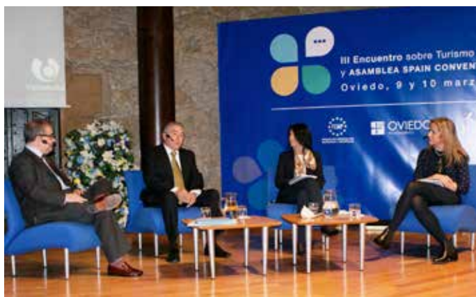
Una de las mesas de debate de la reunión de Oviedo.

turismo de reuniones", en concreto a las que integran el SCB, "que van a seguir trabajando decididamente para que sigamos siendo un destino puntero en el mundo".