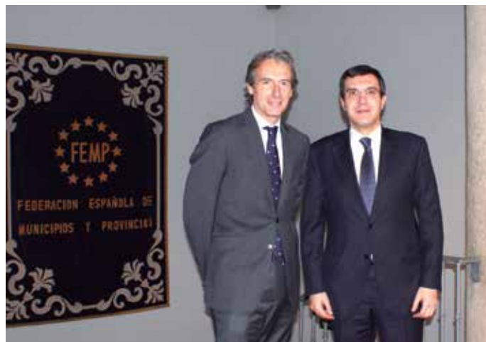
El Presidente de la FEMP, Íñigo de la Serna, y el Secretario de Estado de Relaciones con las Cortes, José Luis Ayllón, analizaron el pasado mes de enero las herramientas que el Gobierno ha puesto a su disposición para facilitar el cumplimiento de las citadas obligaciones.

En este camino hacia la transparencia de la Administración Local, la FEMP contempla otras acciones como la formación de convenios con el Consejo de Transparencia y Buen Gobierno, el Plan de Acción de España para el desarrollo del Gobierno Abierto, o la participación en comités, comisiones interadministrativas y otros foros de trabajo. ★