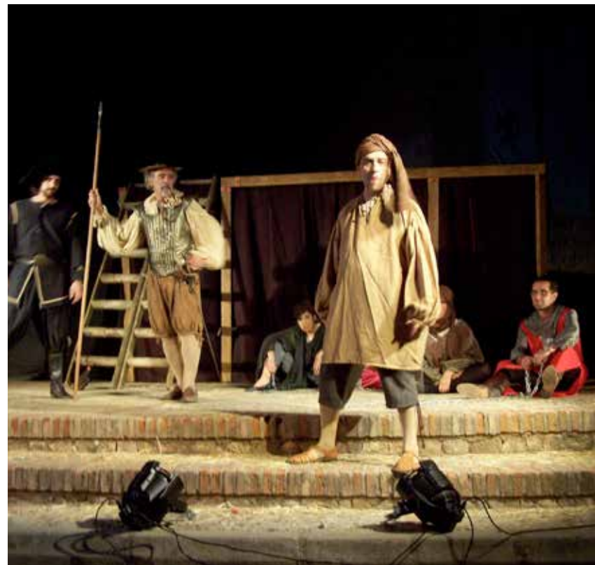
El objetivo del convenio es enriquecer la programación cultural en los municipios.

Para la difusión de la programación teatral, se contará con los medios y herramientas informativas con las que cuenta la FEMP. Escenamateur colaborará con las Entidades Locales en las acciones en que éstas cuenten con grupos de teatro aficionado asociados a la Confederación para la óptima realización de las mismas. ★