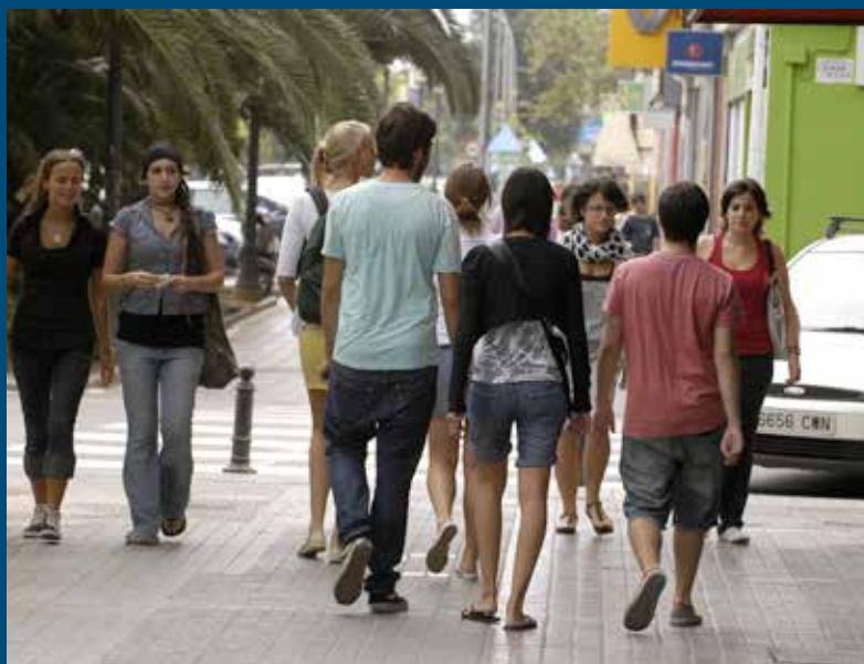
Una nueva prórroga al convenio con el INJUVE permitirá seguir desarrollando programas locales dirigidos a los jóvenes.

Será igualmente posible desarrollar programas locales dirigidos a los jóvenes (mediante la prórroga para 2015 del acuerdo FEMP-INJUVE) y continuar impulsando el consumo responsable de bebidas sin alcohol en el marco de la campaña "En la carretera, cerveza sin", que se viene desarrollando al amparo del convenio entre la FEMP y la Asociación de Cerveceros de España (ACE).