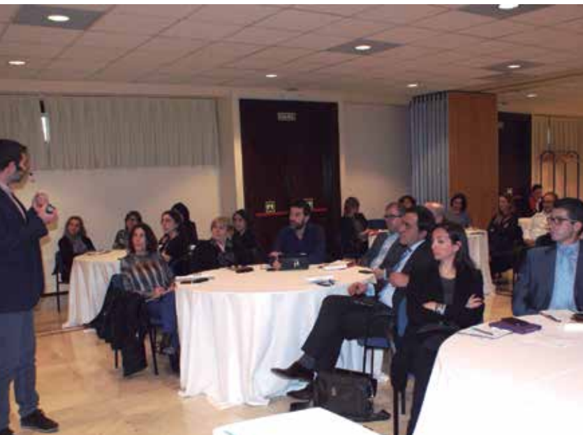
Taller de trabajo.

Además de disponer de destinos que satisfacen cualquier tipo de necesidad, de una de las mejores y más amplias redes de transporte ferroviario de alta velocidad de Europa, y de una de las mejores ofertas hoteleras de Europa, el máximo representante del SCB señaló