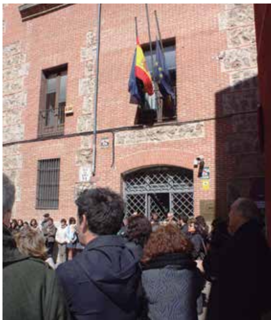
La plantilla de la FEMP durante el minuto de silencio.

La FEMP se unió al luto oficial decretado por el Gobierno por los fallecidos en el accidente aéreo de los Alpes e hizo un llamamiento a las Entidades Locales españolas para que se sumaran a las tres jornadas de duelo que dieron comienzo a las 0 horas del 25 de marzo, colocando sus banderas a media asta durante ese tiempo.