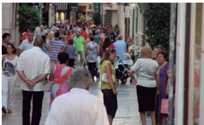
Se busca la modernización y revitalización de zonas urbanas con gran concentración de actividades comerciales minoristas.

Igualmente se considerarán singulares aquellos proyectos de mejora y modernización de equipamientos comerciales localizados en Zonas de