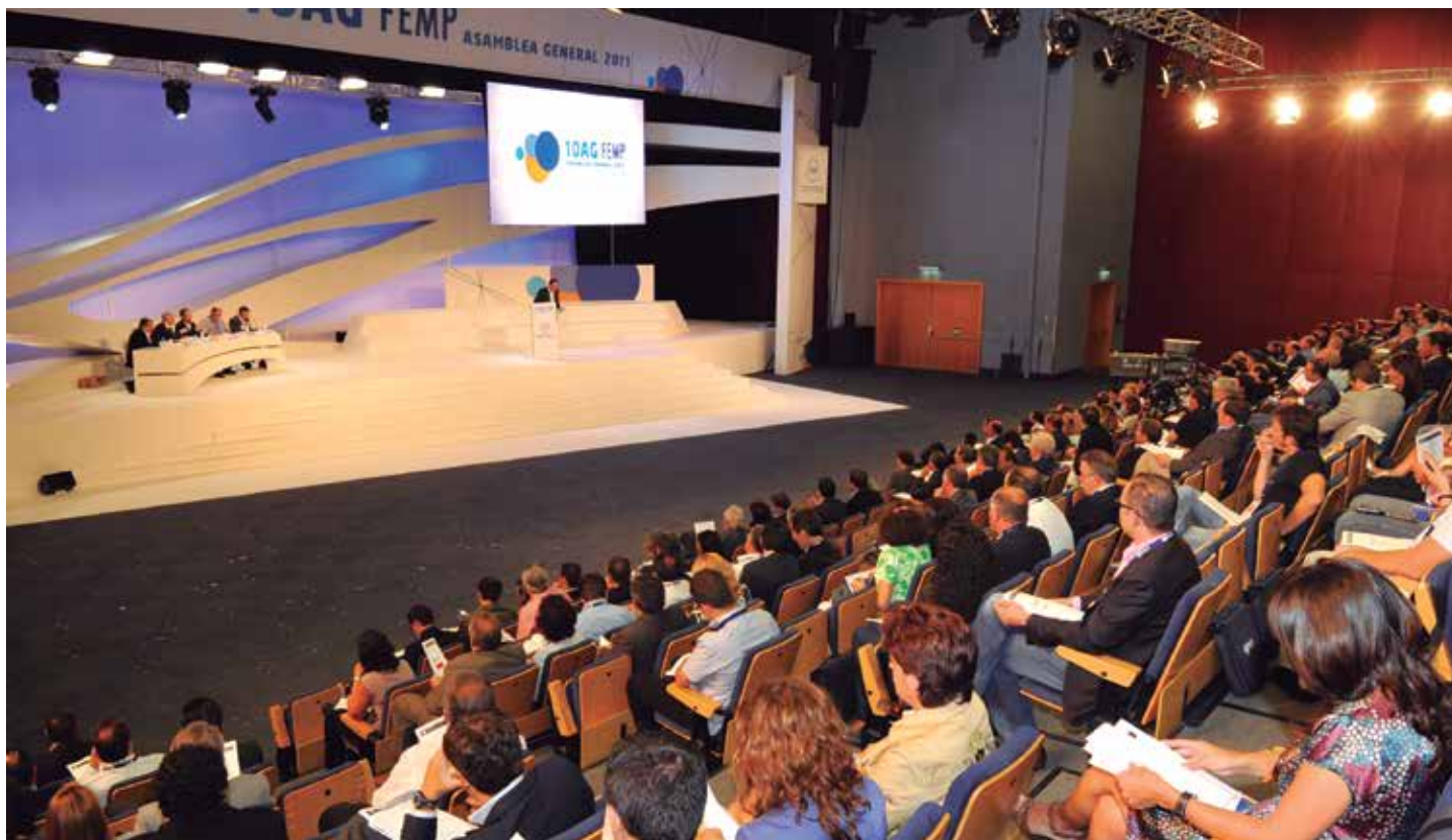
Plenario de la X Asamblea General, celebrada en 2011.

El Pleno es el órgano soberano de la Federación y se reúne, de forma ordinaria, una vez cada cuatro años. Es en este foro, al que están llamados a participar todos los miembros de la Federación, donde se diseña la "hoja de ruta" que marcará el trabajo a desarrollar durante el siguiente mandato de cuatro años y se determina la composición de los órganos de Gobierno de la FEMP (Consejo Territorial, Junta de Gobierno y Presidente) en función de la representación que las diferentes opciones políticas hayan obtenido en los municipios y provincias españoles.